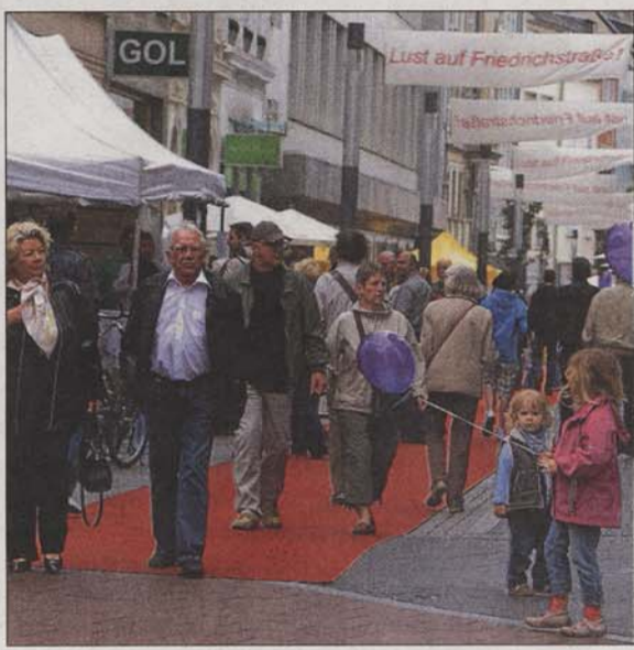
Ein schöner Tag auf der Friedrichstraße

Und das alles gibt einen wunderbaren Vorgeschmack auf den nächsten Urlaub – mitten in Bonn. fhg